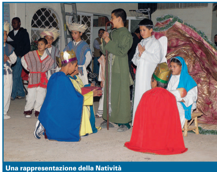
Una rappresentazione della Natività

«Fino al 23 dicembre si organizzano le Posadas, per ricordare il pellegrinaggio di nove giorni di Maria e Giuseppe prima della nascita di Gesù. Bambini e adulti si dedicano all'organizzazione di quest'evento, allestendo una piccola rappresentazione della natività (qualcosa di simile al nostro presepe), accendendo candele e fuochi d'artificio. E in ogni posada è d'obbligo la piñata, un contenitore fatto a mano con cartoncini e carta colorati che si appende al soffitto. Sebbene si tratti di un oggetto di origine cinese, qui in Messico è una tradizione ormai consolidata. All'interno ci si mettono dolcetti, caramelle, cioccolatini. Con gli occhi bendati, si cerca di romperla. È la rappresentazione della lotta interiore contro le tentazioni e il male, per